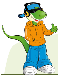
TABLEAU DES GROUPES